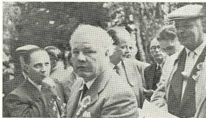
Vasemmalla ja yllä kuorolaisia Jyväskylän laulu-juhlilla.

KANSIKUVA esittää kabinetin seinälä olevaa puista kohokuvaa, jonka kuoro 10-vuotiskonsertissaan sai Pirkan Miehillä.