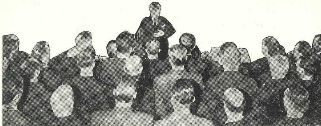
PM-L pers-pektiivistä. Missä ja milloin?